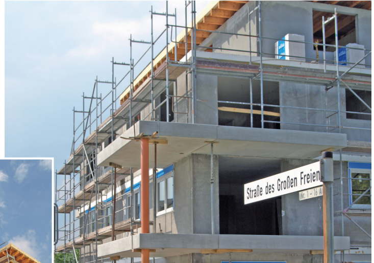
„City-Wohnpark Sehnde“ erfüllt alle energetischen Anforderungen nach EnEV.

Übrigens: Für beide Häuser wird es einen Concierge als Ansprechpartner für alle Alltagsfragen geben - darüber hinaus ist auch die Bereitstellung einer Haushalts-hilfe bzw. die „Urlaubsbetreuung der Wohnung“ als feste Serviceleistung geplant.