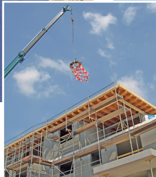
Seit Ende April flattern die bunten Bändchen des Richtkranzes über dem neuen Wohnpark.