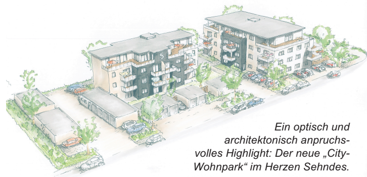
Ein optisch und architektonisch anspruchsvolles Highlight: Der neue „City-Wohnpark“ im Herzen Sehndes.

„Wohnen neu erleben! Ab Ü60!“ - so lautet der einprägsame und zielgruppen-spezifische Slogan, mit dem „Beste Bau“ das Gesamtprojekt versehen hat. So stehen die Gebäude in der „Nordstraße“ und in der „Straße des Großen Freien“ ausschließlich für die Generation „Ü60“ als neues zu Hause bereit.