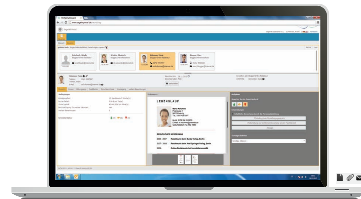
Detailansicht mit elektronischer Bewerberakte für zügige Interaktionen mit allen Beteiligten.