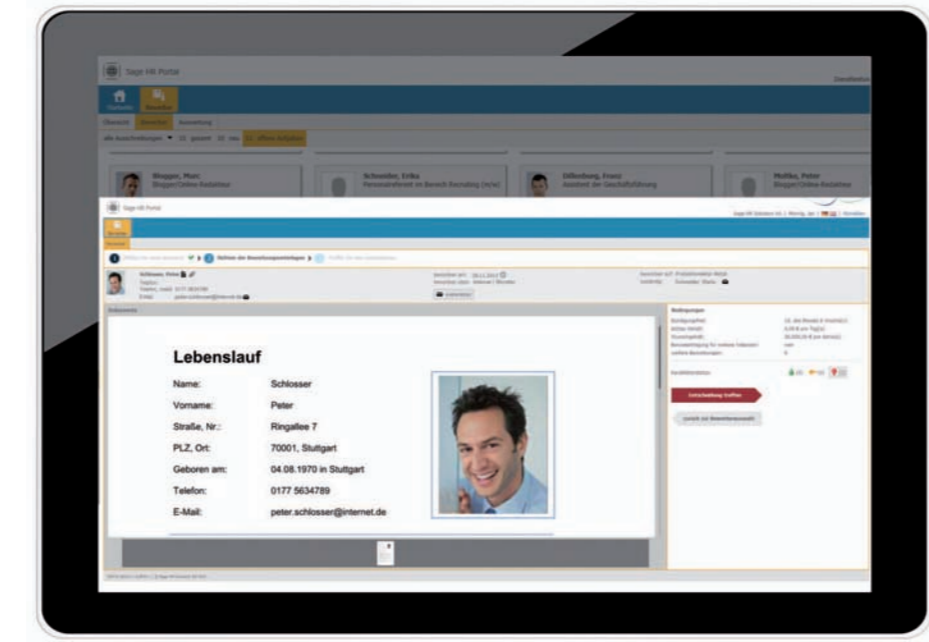
Ansicht für Entscheider mit wenig Zeit: schnell erfassbar und geführt per Assistent bis zur Bewertung.